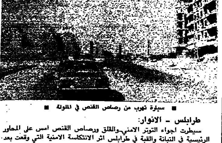
سيرة نوب من رصاص القصف في المولدة